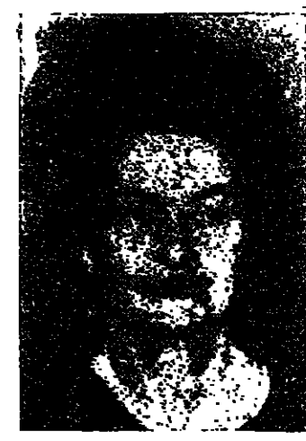
مصدر هذا الاحتجاج عن المغنسة ذات الصوت الزنن اثناء مأدبة غداة اقيمت في البيت الابيض تكريما للقاءات المعاملات في المحل الاجتماعي .

واشنطن - رويتر - جلست خمسون امرأة في صمت وذهول في مدينة غدا في البيت الابيض عندما اخذت المغنسة التي كانت عليها زجاجة بفضة بوجه المديرة بيرد زوجة الرئيس جونسون واتهمت المروج من بيبي المسز جونسون عندما اخذت ابي بيبي تنسكي بفضة من الخزف المسادة في احدى الترتيبات وتقول ان الشبان الامريكيين يتزعمون من بيوتهم لقتلهم في بيتهم .